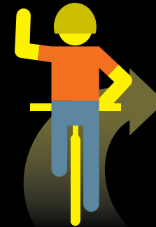
VUELTA A LA DERECHA