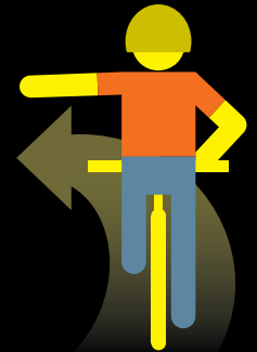
VUELTA A LA IZQUIERDA