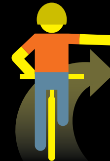
VUELTA OPCIONAL A LA DERECHA